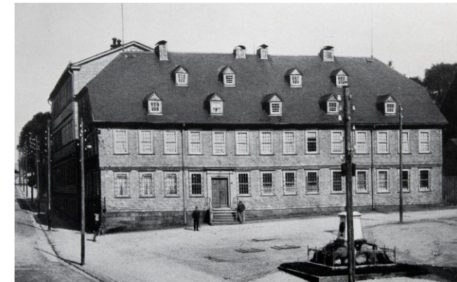
Bergakademie Clausthal um 1890.

TU Clausthal Institut für Bergbau in Zusammenarbeit mit dem Arbeitskreis Altbergbau der DGGT und des DMV, der MU Leoben, der TU Bergakademie Freiberg und der THGA Bochum